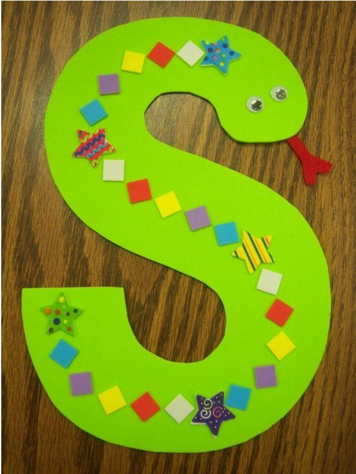
Réalisé par Tracey Lee Warner